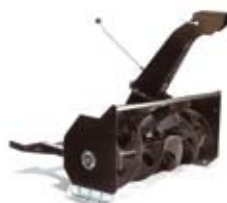
SNESLYNGE (1-TRINS) PARK 11.995,-