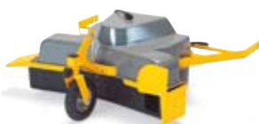
LOVBLÆSER PARK 10.995,-