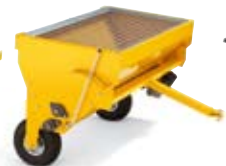
SANDSPREDER PARK 11.995,-