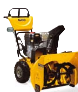
SNOW SPARK/18-2857-29 8.995,-