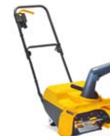
SNOW ELECTRIC 2000/18-2806-29 1.595,-