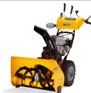
SNOW POWER/18-2847-29 15.995,-

Standard på samtlige sneslyngere i Duo Line+ • 6 gear frem og 2 bak • Elstart og halogenlys En-håndsgreb (dual) • Udkast: Justerbart i højden og til siden • Savtandet sneskruer