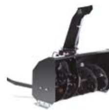
SNESLYNGE (2-TRINS) PARK 13.995,-