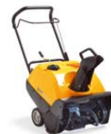
SNOW FROST RS/18-2811-29 5.495,- SNOW FROST ES/18-2812-29 5.995,-

Standard på samtlige sneslyngere i Compact Line • Udkast: Justerbart i højden og til siden • Slagfast, gummibeklædt sneskruer