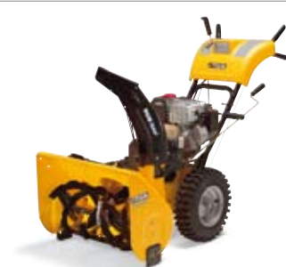
SNOW FLAKE/18-2829-29 13.995,-