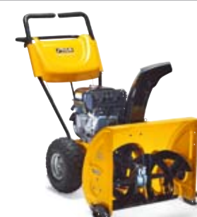
SNOW CRYSTAL/18-2814-29 7.995,-