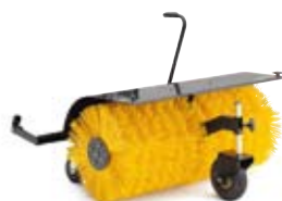
KOST FRA 10.995,-