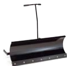
SNEBLAD FRA 2.495,-