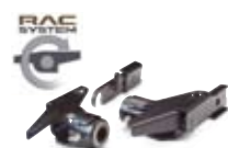
RAC QUICK BESLAG 599,-