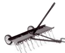
BAGMONTERET RIVE ESTATE