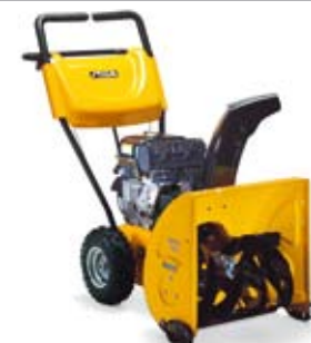
SNOW CUBE/18-2803-29 6.995,-