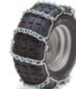
PRO SNEKÆDER 995,-