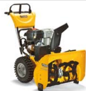
SNOW BLIZZARD/18-2830-29 11.995,-

Standard på samtlige sneslyngere i Duo Line • Skærer sig gennem snedriverne Enhåndsgreb Udkast: Justerbart i højden og til siden • Savtandet sneskruer