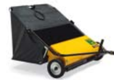
GRÆS- & LOVOPSAMLER 42" 4.495,-