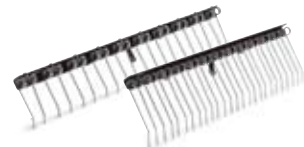
BAGMONTERET RIVE PARK 100 / 130 1.295,-