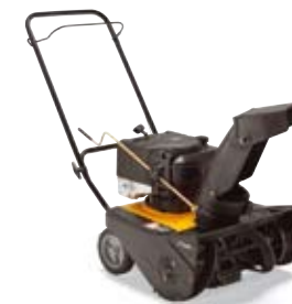
SNOW REX/18-2818-29 3.995,-